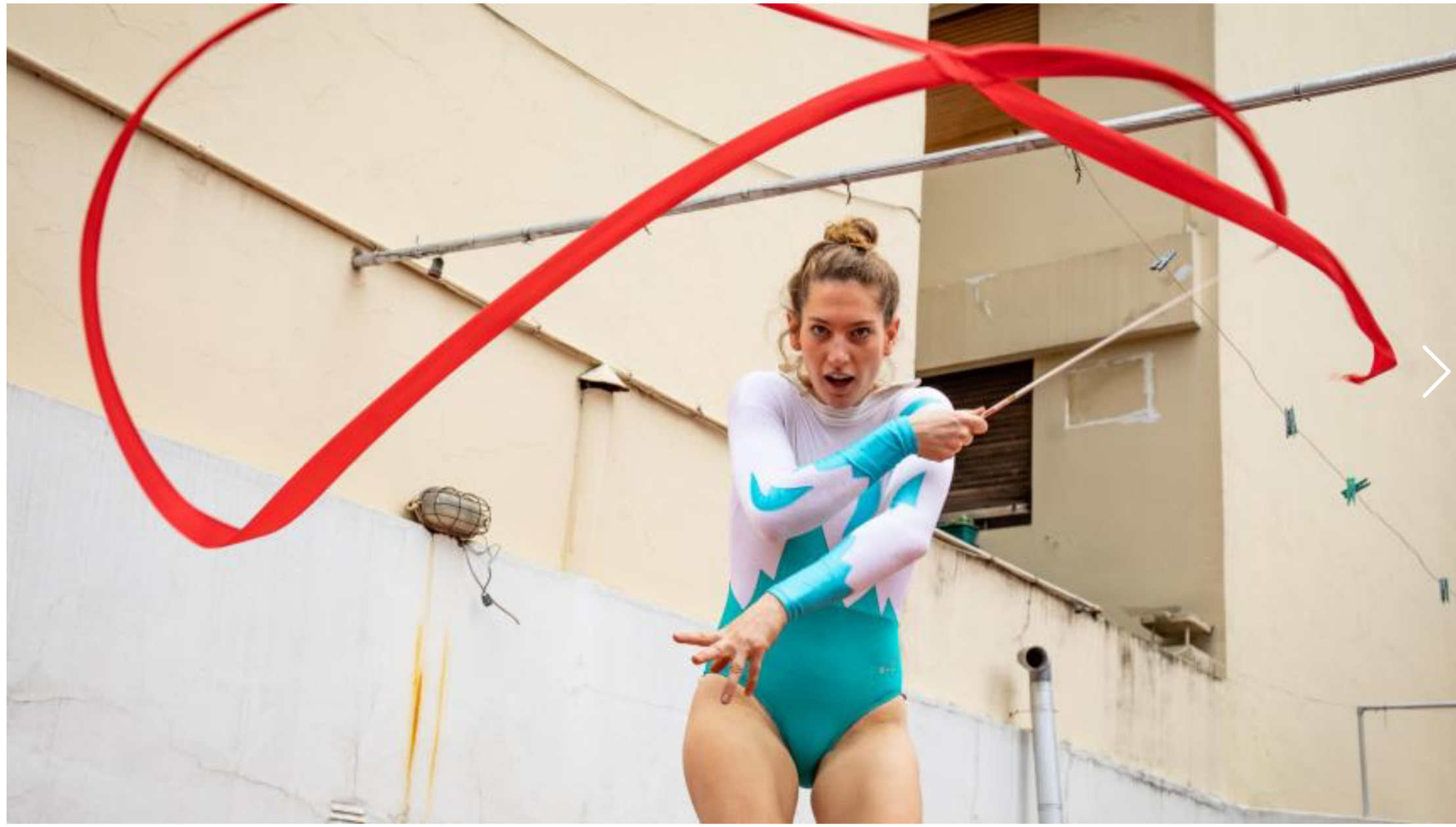
Cruda.