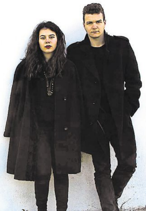
Le duo The Mirrors sera l'un des deux groupes en scène demain au Chabada.

Ce mercredi à 19 heures, au Chabada (02 41 96 13 40). Gratuit pour tous. Rappel, le concert de Jabberwocky + Jumo prévu vendredi est reporté au jeudi 1 er octobre. Remboursement auprès des points de vente jusqu'au 30 avril.